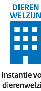
Instantie voor dierenwelzijn