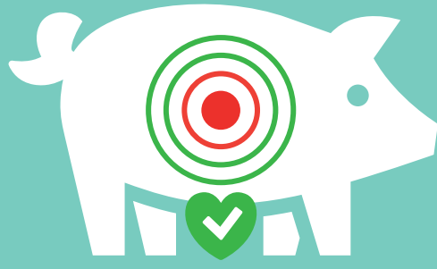
Zo min mogelijk pijn voor het dier

Alle betrokkenen hebben in hun specifieke rol een verplichting om het ongerief voor het dier, onder meer in termen van pijn, zo laag mogelijk te houden. Dit vergt van alle betrokkenen een grote inspanning.